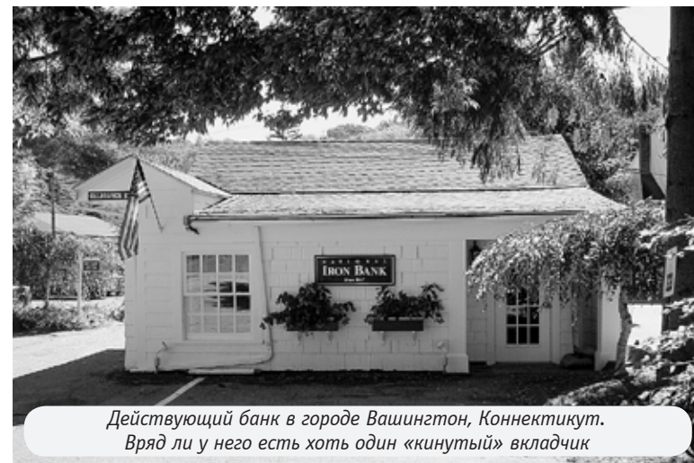
Действующий банк в городе Вашингтон, Коннектикут. Вряд ли у него есть хоть один «кинутый» вкладчик

А вот с продуктами ситуация обстоит несколько по-иному. В американских супермаркетах почти все они значительно дороже, чем в России. Особенно, как мне показалось, молочные продукты. Хотя сравнивать довольно сложно. Во-первых, то же мясо и колбасы каких-то непонятных сортов, аналогов которым в российском ассортименте найти сложно, особенно если толком не можешь перевести ценники. Во-вторых, все цены уфунта за pound (американский фунт 0,453 кг), вроде и не полкило. Вот