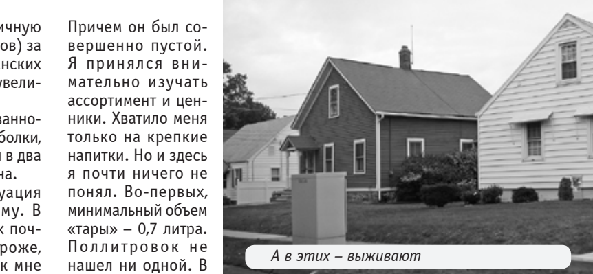
А в этих – выживают

Причем он был совершенно пустой. Я принялся внимательно изучать ассортимент и ценники. Но и здесь я почти ничего не понял. Во-первых, минимальный объем «стары» – 0,7 литра. Поллитровок не нашел ни одной. В основном бутылки по 1,5 – 1,7 литра и более. Во-вторых, я так и не осилил ценников. Допустим на бутылке 0,7 «Смирновской» крупными цифрами значится 17$, а в верхнем левом углу мелконько 21,45$. Можно, конечно, догадаться, что это конечная цена с акцизом. Но как спросить, если связать по-английски мошью