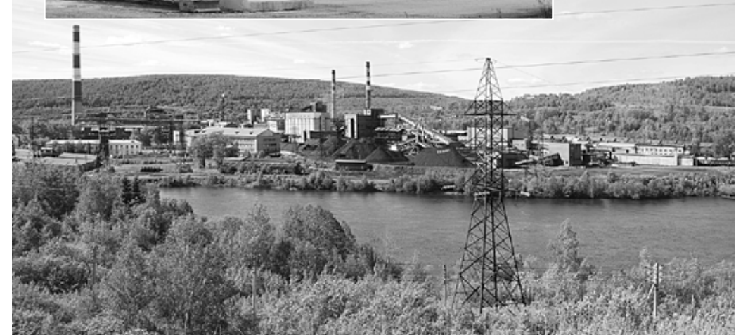
Материалы подготовил Юрий МАНЖОСИН