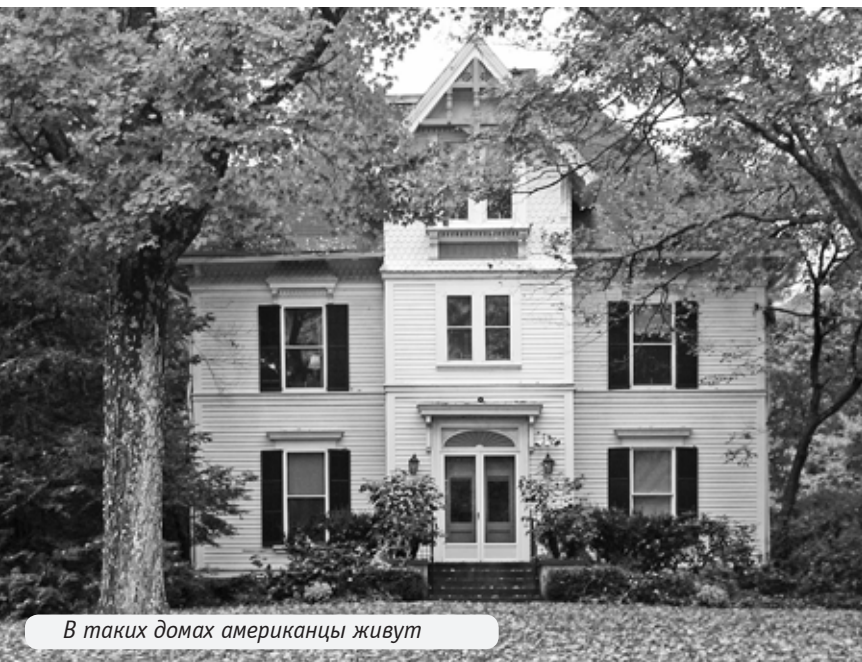
В таких домах американцы живут

А вот классический алкогольный магазин мне показали только один.